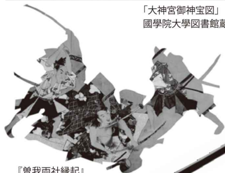
『曾我兩社縁起』