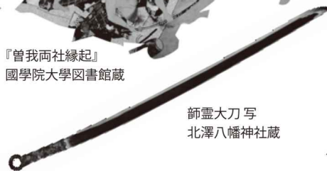
師霊大刀写 北澤八幡神社蔵

刀剣は、日本の神祭りの長い歴史のなかで、神のはたらきを表したり、神への重要な捧げ物と位置づけられてきました。