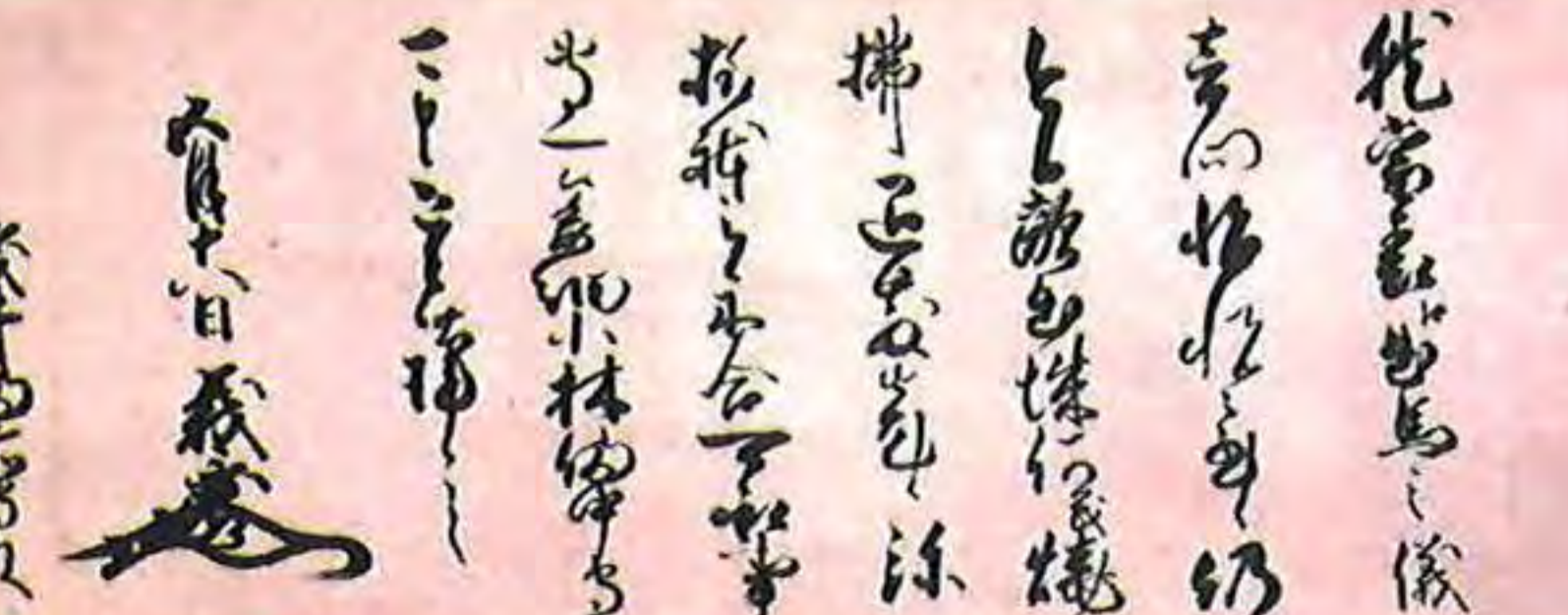
▲朝倉義景書状 浅井長政宛 大阪城天守閣蔵