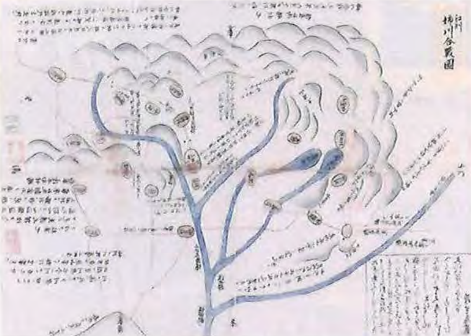
▲江州姉川合戦図 重要文化財 彦根城博物館蔵