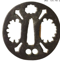
雪輪・四方剣透鉄鐔 号 残雪 名物