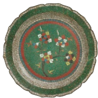
唐花文七宝菓子鉢 中国・明時代 16-17世紀