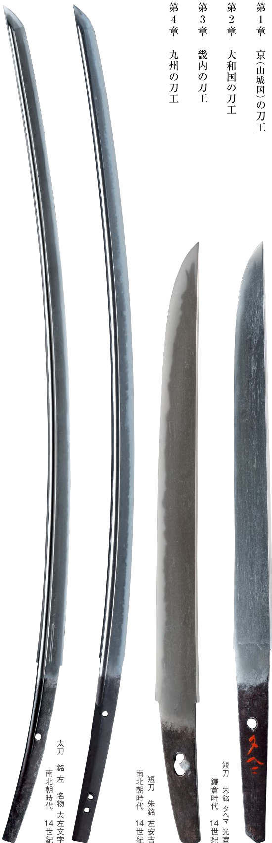
太刀 銘左 名物大左文字 南北朝時代 14世紀

古くから日本各地で刀剣が生産されてきましたが、なかでも山城国(京都府)と大和国(奈良県)は都が置かれたことから、貴族や寺院の需要に応じた作刀が盛んに行われました。また大和国の刀工たちの作風は、九州の刀工たちに少なからぬ影響を及ぼしました。山城国・大和国を中心とした畿内の刀工の作品や九州の刀工の作品を紹介します。