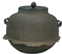
天明真形釜 江戸時代 17世紀 岡谷家寄贈