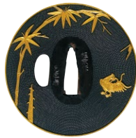
竹に鶏園四分一銅 銘 程乗作 光孝(花押)