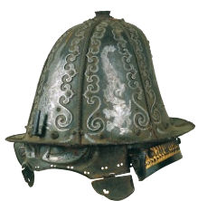
龍文象嵌南蛮兜 枕山〜江戸時代 16-17世紀