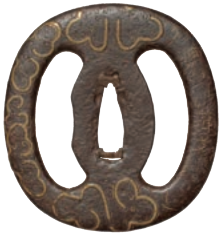
左右海鼠透かし鐙 (大分県個人)