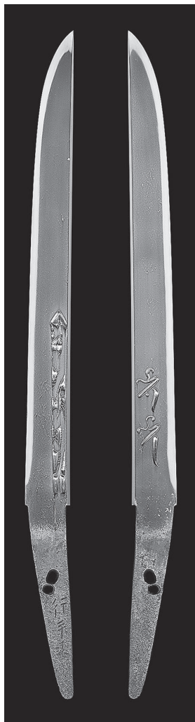
短刀 銘「行平作」 大分県立歴史博物館

大分県は、平安時代後期から鎌倉時代初期にかけて作刀した名工行平をはじめ、室町時代から江戸時代にかけて、高田庄（現在の高田市鶴崎地区）で作刀した高田鍛冶が多くの作品を残しており、わが国を代表する日本刀の生産地の一つでした。平安時代後期から江戸時代まで、700年余りにわたって、連綿と日本刀がつくり続けられたところに大分県の刀剣史の特色があります。