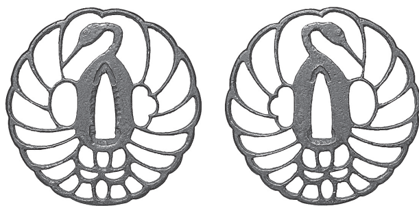
鶴丸文透かし鏝（大分県個人）