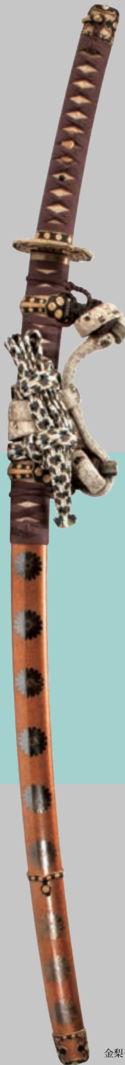
太刀 銘「国光」(大分県個人)

〒872-0101 大分県宇佐市大字高森字京塚 TEL 0978-37-2100 FAX 0978-37-2101 https://www.pref.oita.jp/site/rekishihakubutsukan/ E-mail a31702@pref.oita.lg.jp