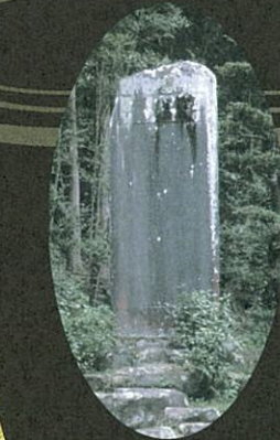
刀工志津三郎兼氏之碑(善教寺境内)