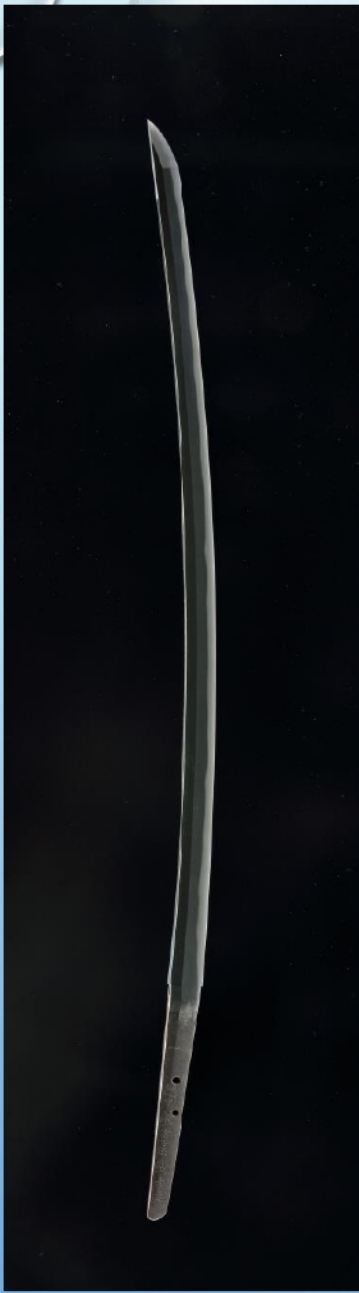
太刀 銘「一越州敦賀住盛重作」